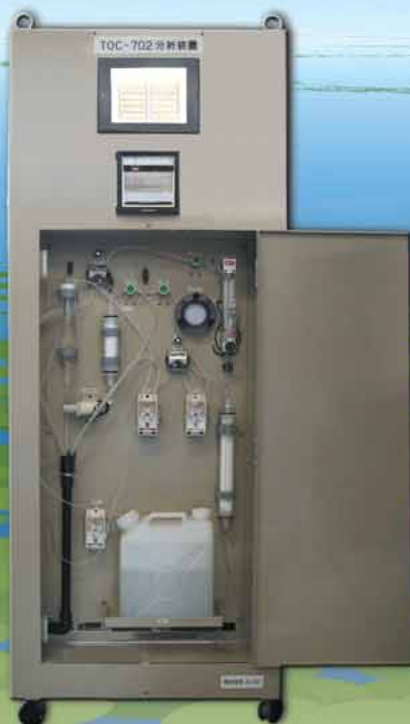
TOC-702自動測定装置（外観図）

TOC-702自動測定装置は、工場排水・河川・湖沼・海域等の水質に含まれている全有機体炭素量（水質の汚濁状況の指標）を、迅速かつ正確に自動測定（水質の中の全有機体炭素を酸化させ、その酸化した二酸化炭素量を測定して、水質の汚れを測定）する装置です。